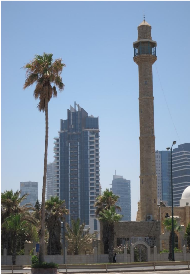
Hassan-Bek-Moschee an der Promenade Tel Aviv nach Jaffo

Um das gesammelte Konfliktpotential angemessen für Studierende aufzudröseln, bräuchte es an der Universität als Lehrkraft für ‚Israel Studies‘ oder ‚International Relations‘ mindestens zwei Semester ... Der deutsche SS-Mann und spätere Literaturnobelpreisträger Günther Grass bezeichnete Israel in einem Gedicht u.a. als ‚Gefahr für den Weltfrieden!‘ Berechtigte Israelkritik oder virulenter, eliminatorischer Antizionismus? Was folgt? Sollte Israel ganztägig geschlossen werden?