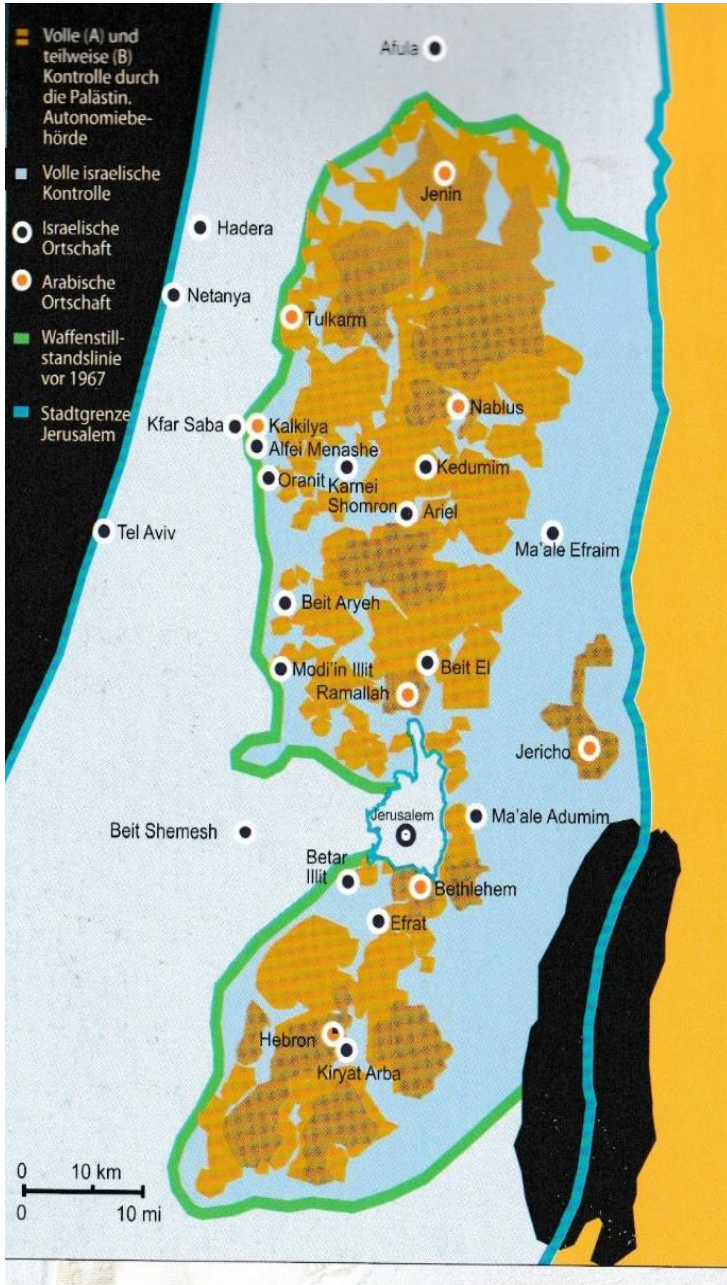
Arabische Orte im palästinensischen Autonomiegebiet