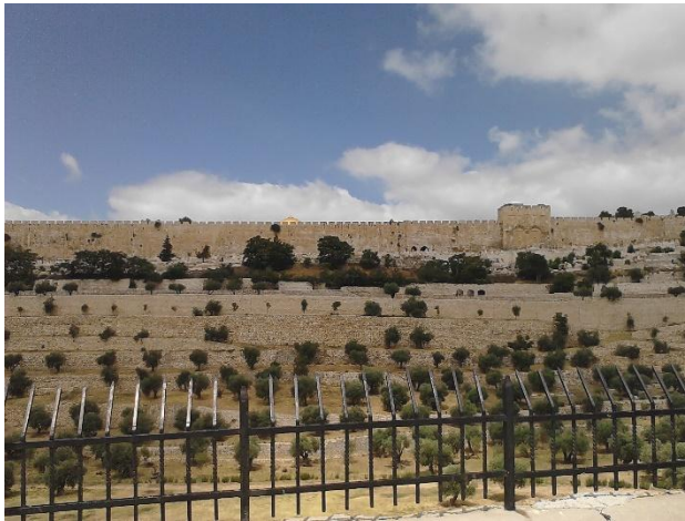
Hier wird der Messias erwartet: das Goldene Tor in Jerusalem ist zugemauert – davor ein Friedhof – oben links: Kuppel des Felsendoms