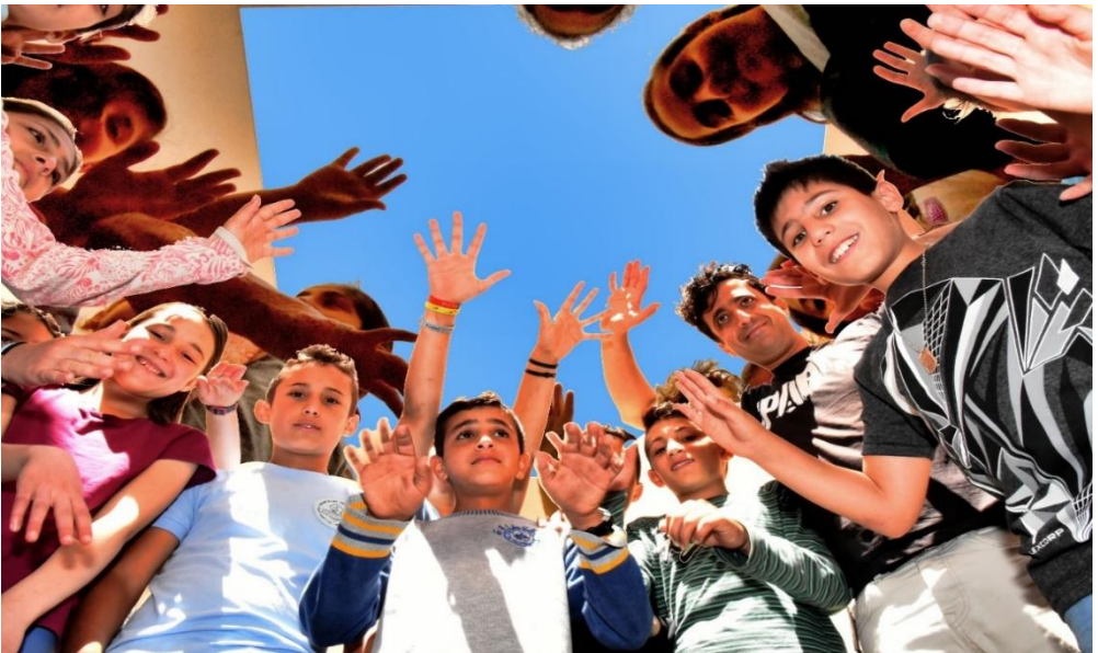
Bridging the Gap – eine friedliche Zukunft liegt in den Händen der Kinder mittels ihre Lebens-Kunst

Golan im Norden. Ein Teil dieser Binnenflüchtlinge kampierte samt Kindern in Hotels respektive in den stillgelegten Seitentrakten des Israel Museums über den Hügeln Jerusalem. Dort im Israel Museum gibt