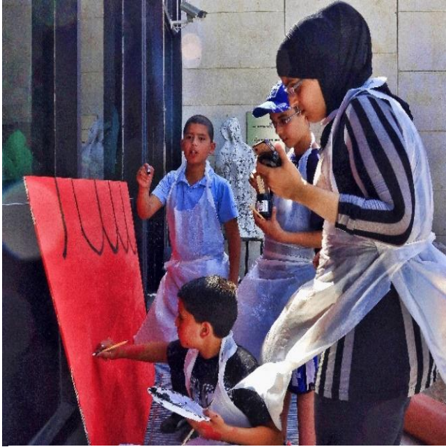
Gemeinsam Zukunft gestalten: Jüdische und arabische Jugendliche malen zusammen im Projekt ‚Bridging the Gap‘

Es sind Menschen wie der palästinensisch-amerikanische Literaturwissenschaftler Edward Said (1935-2003) und der argentinische Jude mit deutschem und israelischem - sowie ehrenhalber einem palästinensischem Pass - Daniel Barenboim, die sich für ein Miteinander einsetzen. Sie gründeten den Ost-Westlichen Diwan, haben ein Orchester gegründet, dass weltweit agiert dessen Mitglieder palästinensischer und jüdischer Provenienz sind.