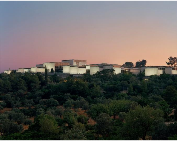
Über den Hügeln Jerusalems schwebt das Israel Museum

Es wird hierzulande kaum wahrgenommen, dass auch über 300.000 – 500.000 Menschen mit israelischem Pass aus dem Süden und Norden - from Israel's fringes, ins Landesinnere fliehen mussten wegen der Terrorangriffe der Hamas im Süden und der Kampfhandlungen der Hisbollah am